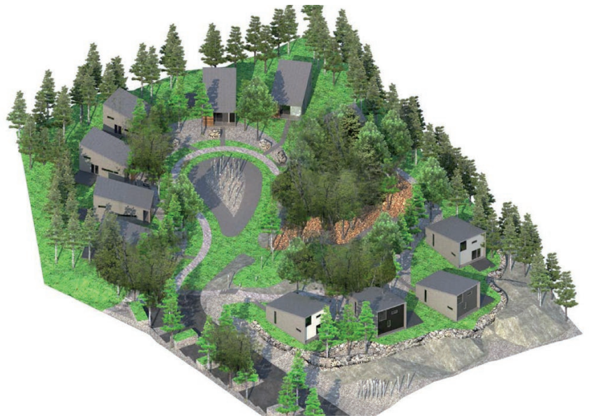
vue d'ensemble espace commun