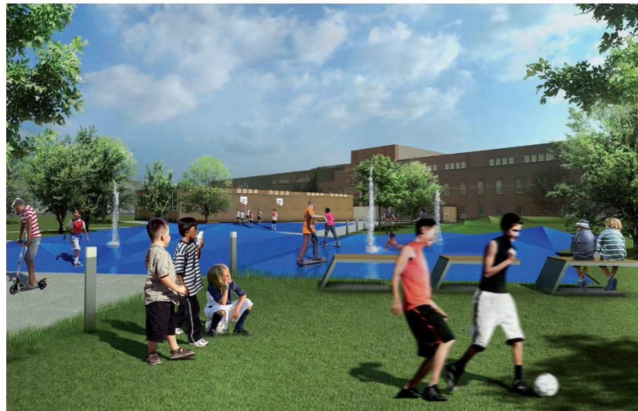
perspective du terrain de jeux