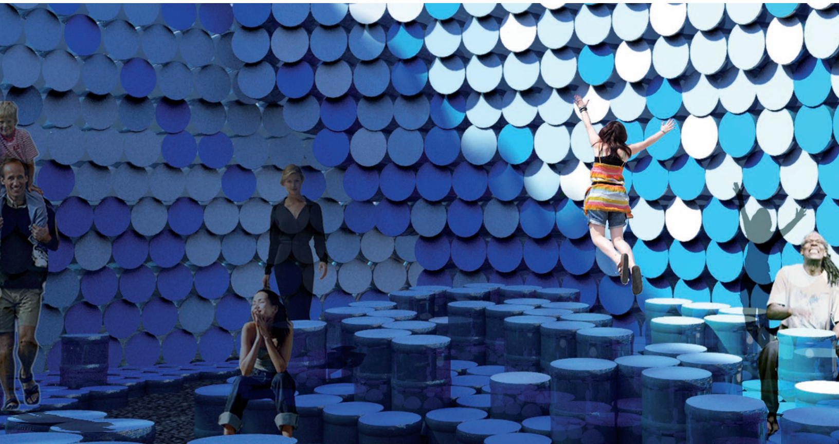
l'eau en mouvement