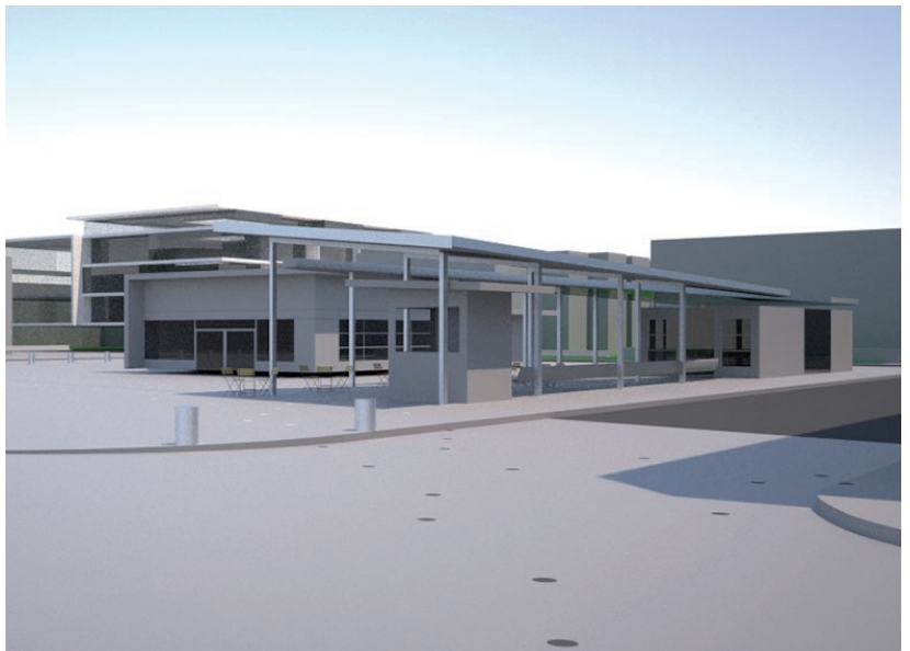
ouverture de la place