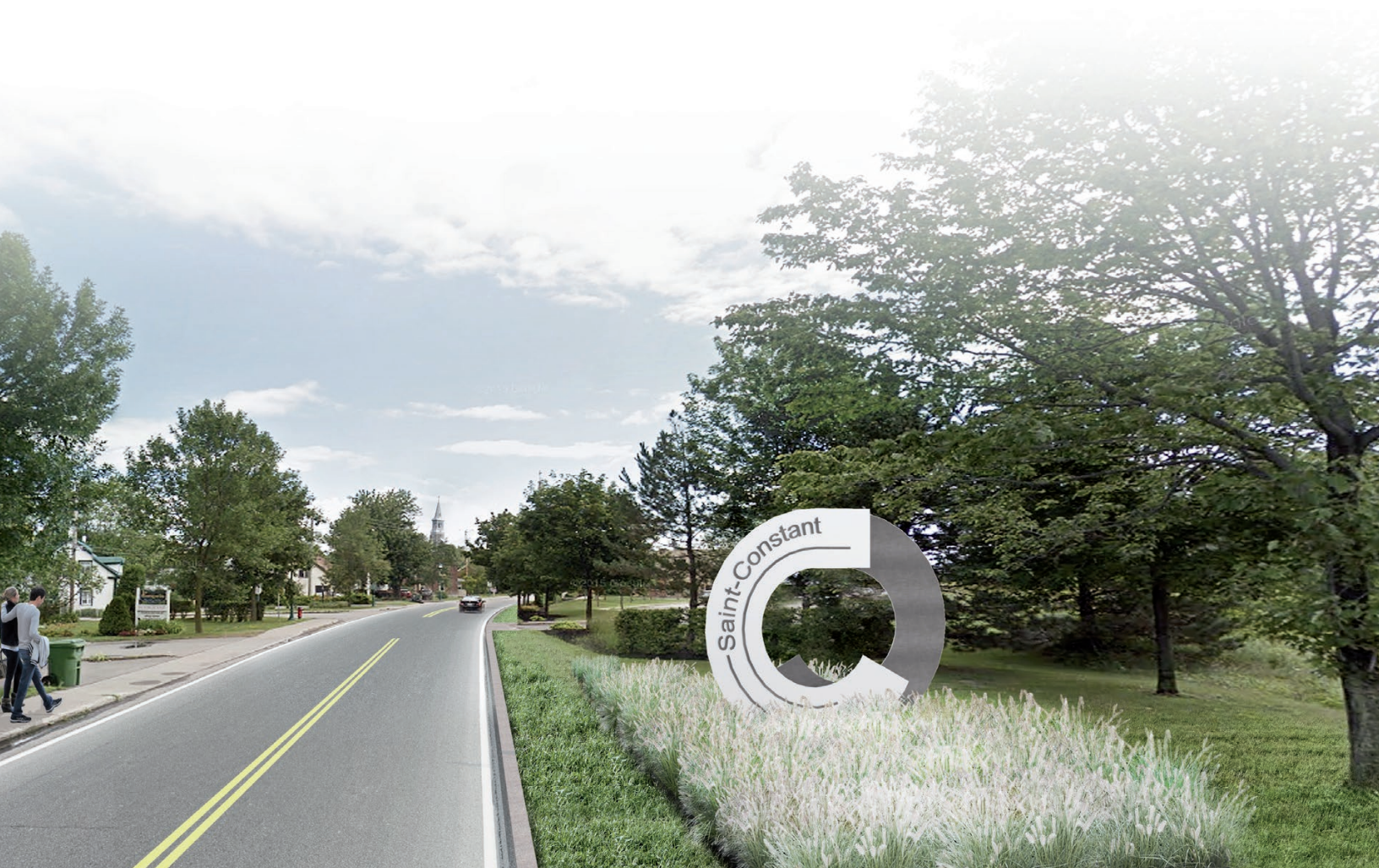
↓ aménagement d'entrée de ville / type sur butte - rue Saint-Pierre