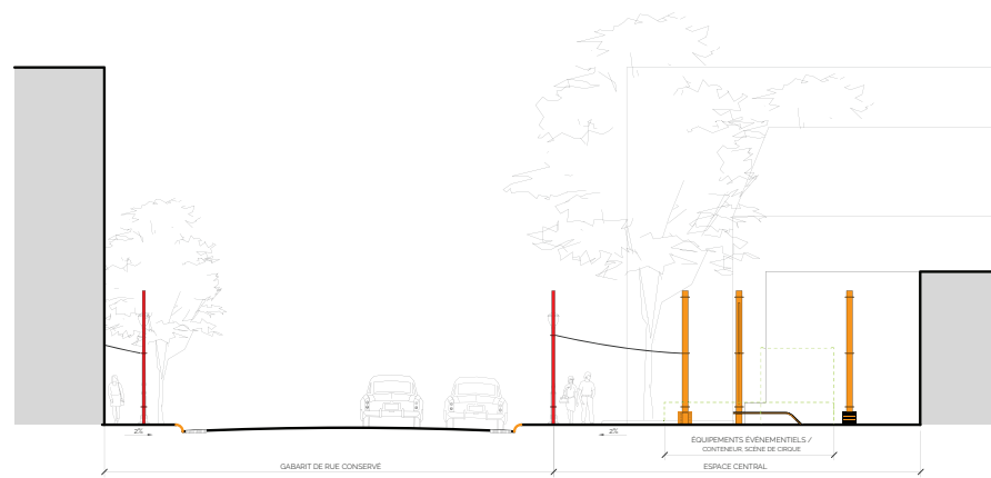
implantation des principaux éléments de compositions de la place