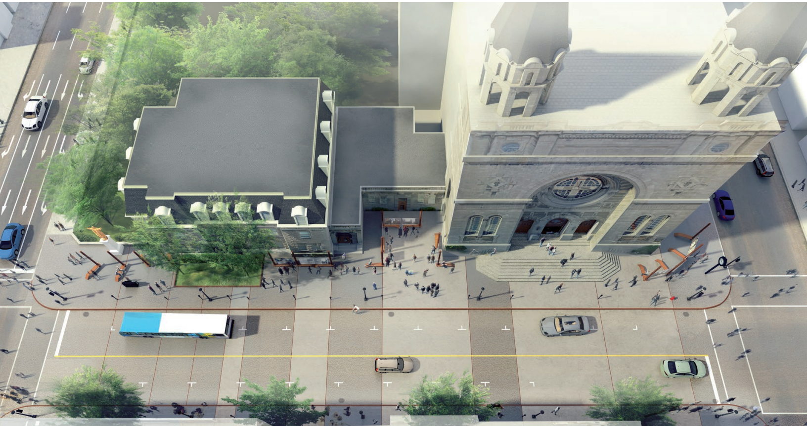
la place au quotidien