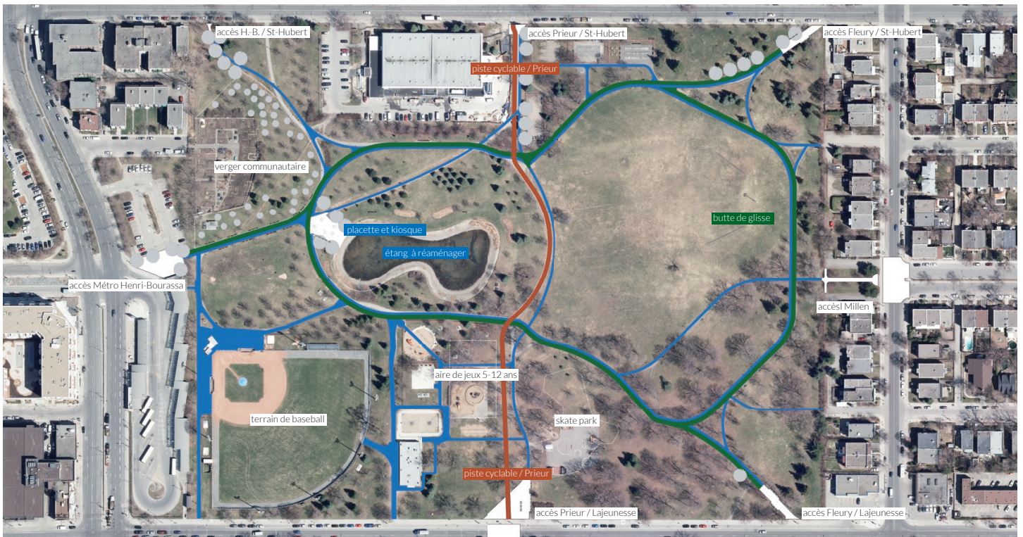
↓ plan schématique / sentiers, piste cyclable, accès et zones à réaménager