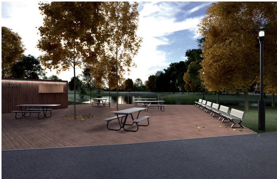
↑ perspective b / aménagement d'un quai et kiosk pour l'étang